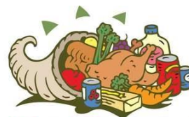
Colecta de Alimentos para el Día de Acción de Gracias

Hoy es el último día aceptando donaciones de comida enlatada o secas (nada de vidrio) para el Día de Acción de Gracias. Toda comida colectada será donado a las Hermanas de La Renovación en Bainbridge Avenue.