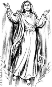
Assumption of the Blessed Virgin Mary

Wednesday, August 14 5:30 pm 7:30 pm Fire Rosary Thursday, August 15 8:00 am 9:00 am (Spanish) 7:30pm (Bilingual)