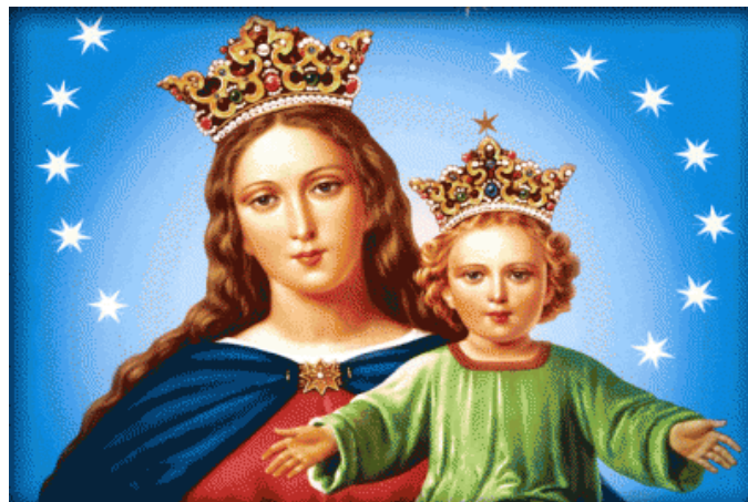
Pintura en la Catedral de San Mateo, 1725 Rhode Island Avenue, NW María Auxiliadora. Festividad: 24 de mayo.

conciertos para coros. El domingo pasado el último concierto se realizó en la parroquia de San Martín en la calle North Capitol. ¡Que el Señor bendiga a nuestros jóvenes!