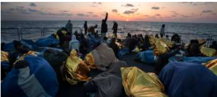
A group of rescued people on the deck of an Italian naval vessel as the sun sets in the Mediterranean.

Dios de nuestros Ancestros Errantes, cuánto tiempo hemos sabido que tu corazón está con el refugiado: que naciste en el tiempo en una familia de refugiados Huyendo de la violencia en su tierra natal, ¿quién luego reunió a su hijo hambriento? y huyó al país extranjero. su llanto, tu llanto, resuena a través de las edades: "¿Me dejarás entrar?" danos corazones que se abren cuando nuestros hermanos y hermanas se dirigen a nosotros con ese mismo llanto Entonces seguramente todas estas cosas seguirán: los oídos ya no se volverán sordos a sus voces. los ojos verán un momento de gracia en lugar de una amenaza. las lenguas no se silenciarán, sino que defenderán. y las manos se extenderán trabajando por la paz en su tierra natal, trabajando por la justicia en tierras donde buscan refugio seguro. Señor, protege a todos los refugiados en sus viajes. que encuentren un amigo en mí y entonces hazme digno del refugio que he encontrado en ti. AMÉN.