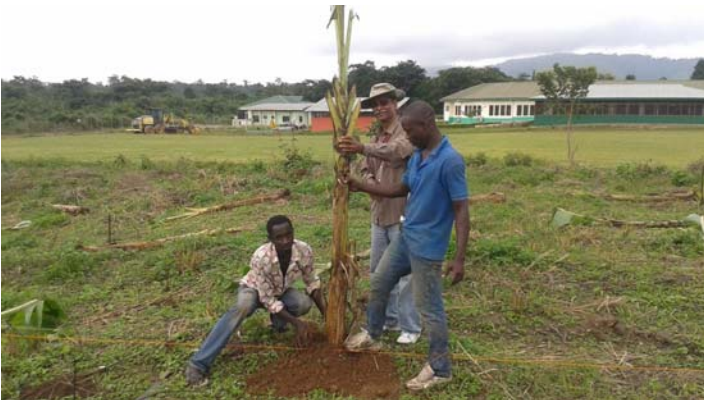
Awaso Mission to Ghana - Planting Plantains

Your Total Gift to Others _____ $228,056