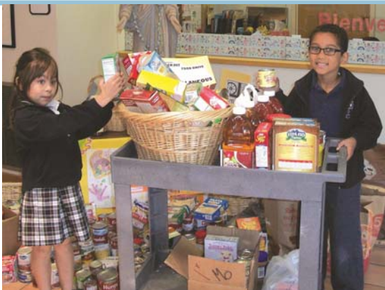
St. Catherine School Food Drive for ReachOut

Through the gifts of our good stewards, St. Catherine Parish has provided support to charitable organizations globally, locally, and to those in need in our parish. A través de sus dones de ser un buen steward, la parroquia de Santa Catalina ha brindado ayuda a organizaciones internacionales, locales y atiende a personas necesitadas en nuestra parroquia.