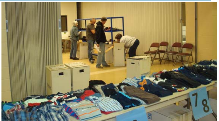
St. Vincent de Paul - Preparing for Clothes Give Away