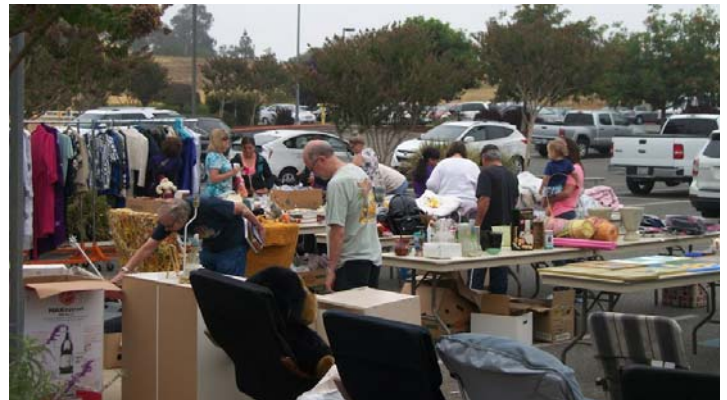
Ladies of Charity - Rummage Sale

Through the gifts of our good stewards, St. Catherine Parish has provided support to charitable organizations globally, locally, and to those in need in our parish. A través de sus dones de ser un buen steward, la parroquia de Santa Catalina ha brindado ayuda a organizaciones internacionales, locales y atiende a personas necesitadas en nuestra parroquia.