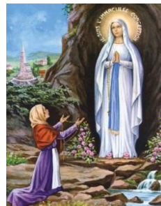
N.D. de Lourdes priez pour nous