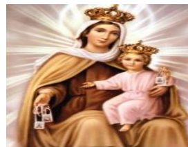
N.-D. du Mont Carmel priez pour nous