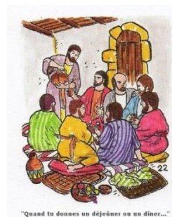
"Quand tu donnes un déjeuner ou un dîner..."