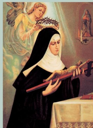
Santa Rita "Santa de los Imposibles"

O HI DIOS, que con infinita dulzura, respondes a las plegarias de tu servidora, Santa Rita, y le concedes las súplicas que parecen imposibles a la visión humana, en recompensa de su compasivo amor y firme confianza en tus promesas, ten compasión en nuestra adversidad y socórrenos en nuestra calamidad, que el no creyente pueda conocerte, es la recompensa del humilde, defende al desamparado, da fuerza a los que confian en Ti, por Jesucristo. Nuestro Señor. Amén.